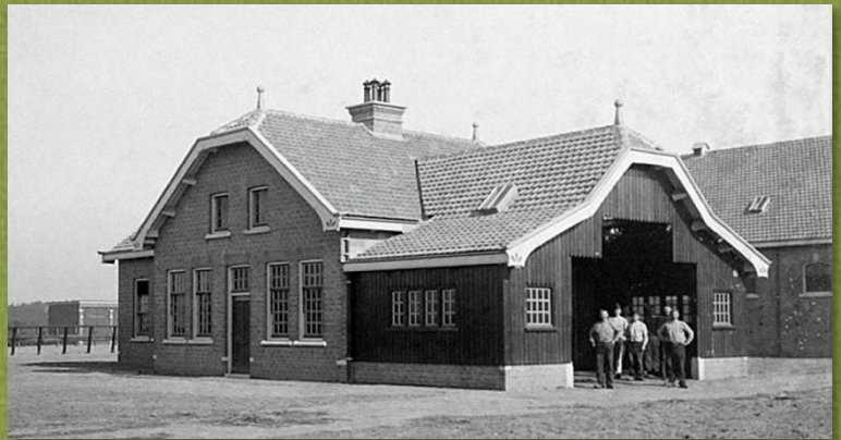
De Smederij anno 1908

Na een aantal mooie jaren in ons militair-historisch informatiepunt onder de Heidebrouwerij verhuist het Platform Militaire Historie Ede deze zomer naar gebouw 27 op de Arthur Koolkazerne in Ede. Het monumentale gebouw uit 1908 kent een fraaie, militaire geschiedenis en is gelegen naast de paardenstallen en bijhorende magazijnen. 'De Smederij' bevatte een werkplaats voor de zwaardveger en twee werkplaatsen voor de hoefsmeden (smidse), met een beslagloods voor de beide eskadrons Huzaren die in de cavaleriekazerne waren gehuisvest.