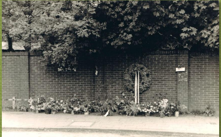
Monument Appelweg anno 1946

De tien verzetsmensen werden na een wapendropping in de nacht van 8 op 9 maart 1945 door de Duitse bezetter gearresteerd in het bosgebied tussen Ede en Lunteren. Zij werden daarna overgebracht naar Kamp Amersfoort, waar zij als "Todeskandidaten" werden opgesloten. De Duitse bezetter had bepaald dat voor elke door het verzet gedode Duitser of Duitsgezinde Nederlander tien Nederlanders terechtgesteld zouden worden.