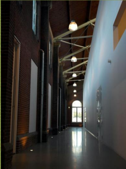
Nieuw in oud

Het kazernegebouw heeft, samen met de naastgelegen Mauritskazerne, meer dan 100 jaar dienst gedaan als trainings- en huisvestingcomplex voor militairen. In de Tweede Wereldoorlog werd het gebruikt door de Duitse Kriegsmarine en daarom tijdens operatie Market Garden gebombardeerd. Van de oorspronkelijk, rijk gedecoreerd neorenaissance voorgevel was de kapverdieping ernstig beschadigd. Rond 1948 zijn de achtervleugels geheel nieuw opgetrokken en zijn de dakhuizen op de voorbouw sober hersteld. Na de oorlog is het complex verder dichtgetimmerd in jaren '70-stijl. Zo werden de granitvloeren afgedekt met linoleum en systeemplafonds en grindlambrisering aangebracht. Bij de herbestemming en restauratie is het monument zoveel mogelijk teruggebracht naar de situatie van 1906. De oorspronkelijke kleuren van deuren, kozijnen en muren zijn opnieuw aangebracht en ook de houten ramen met roeden zijn gerestaureerd.