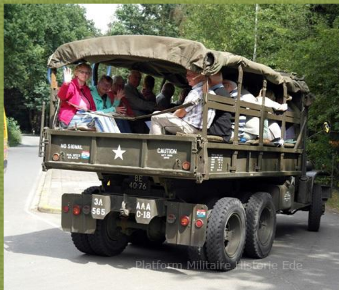
Battlefieldtour Platform M.H.E.