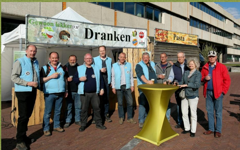
Platform Militaire Historie Ede

De zaterdag begon met een herdenking bij het Bevrijdingsmonument, waarna de burgemeester het Edese bevrijdingsfeest opende met een luid kanonschot uit een 6 Veld uit 1894. Echte blikvangers waren de grote Shermantank en een Nederlandse M38 (Landsverk) pantserwagen. De Bereden Artillerie anno 1940 was terug in Ede met een prachtig uitgedost span paarden met bijhorende manschappen en kanon. Tal van re-enactmentgroepen, wapens en militaire voertuigen konden bij het raadhuis worden bekeken. Rondom de oude kerk konden bezoekers terecht bij een militairmarkt. Bij de kraam van het platform konden kinderen een stempelkaart ophalen waarmee een bevrijdingsbutton kon worden verdiend. Er was voor hen nog veel meer te beleven deze dag. Zo konden ze terecht bij de trainingswagen van de Luchtmobiele Brigade, deelnemen aan Scoutingactiviteiten, springen op een Bungy trampoline, zweven in een zweefmolen en al hun energie kwijt op een luchtkussen-stormbaan. In de Grotestraat trok de doedelzakmuziek van de Pegasus Pipes and Drums veel publiek. De band of Four Brothers en het Vrijwillig Muziek- en Tamboerkorps van de Verbindingsdienst speelden er lustig op los en bij de Zingende Kapsters kon je naast genieten van jaren-veertig-muziek ook gelijk je haar laten doen! Wat wil je nog meer, als burger van Ede! ☺